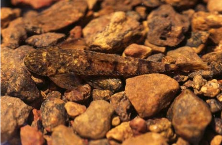
foto/ TronLarsen Hartiella crassicauda, een endemische vissoort van het Nassaugebergte