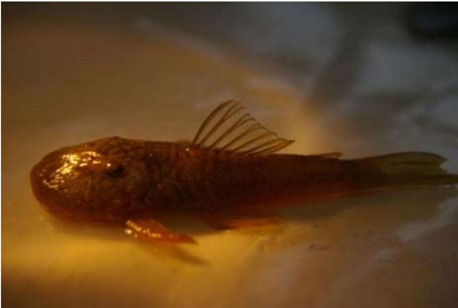
De pas ontdekte vissoort Pseudancistrus 'bigmouth' van de Paramakakreek, Nassaugebergte.-.