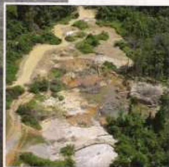
CHANTIER TYPIQUE D'ORPAILLAGE CLANDESTIN.